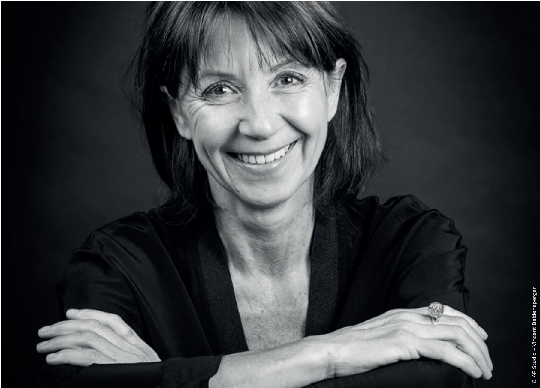
© AF Studio - Vincent Baldensperger