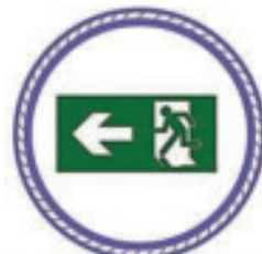
La sortie de secours