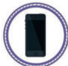
La plupart des technologies de communication