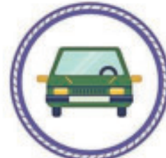
Le chauffage de voiture