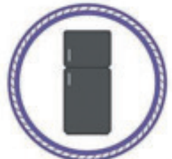
Le réfrigérateur électrique moderne