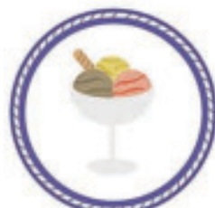
La machine à crème glacée