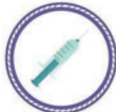
La seringue médicale