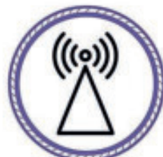
Les transmissions sans fil