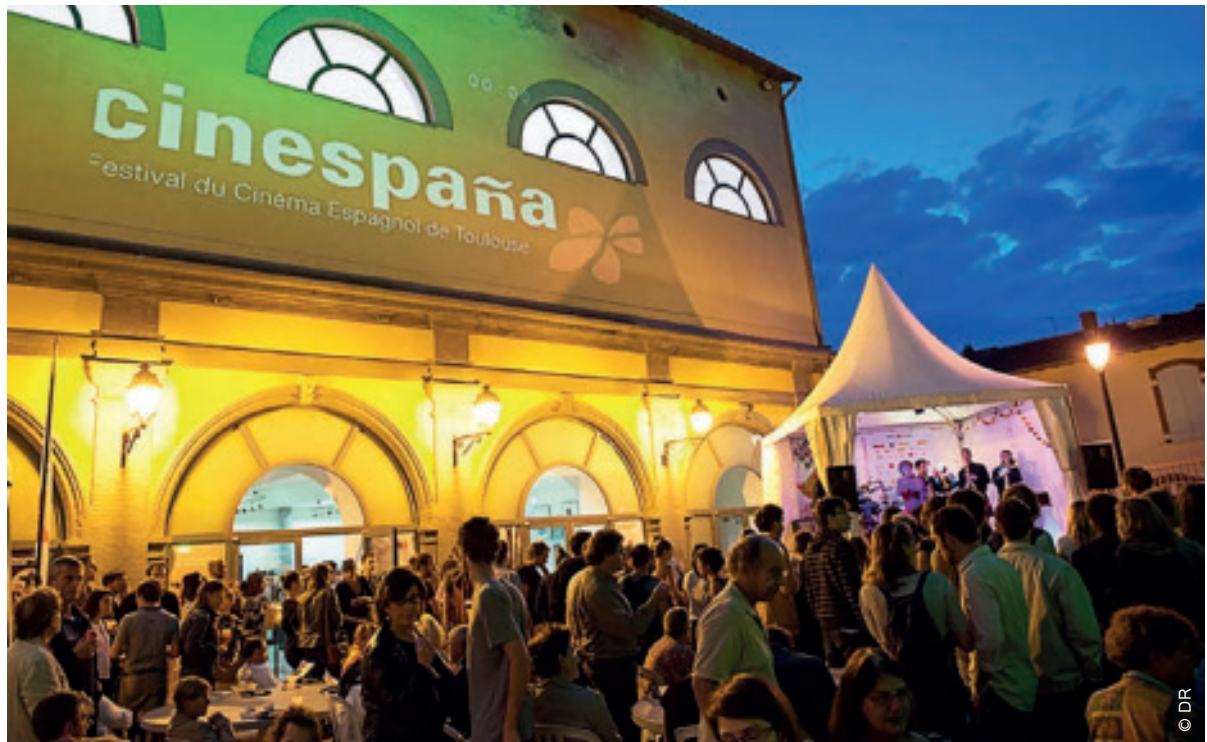
Cinespaña, le plus grand festival du film ibérique hors des frontières espagnoles

Le JT a sélectionné quelques bonnes raisons de mettre le nez dehors durant ce premier week-end d'octobre. Culture, sport, balade... Il y en a pour tous les goûts.