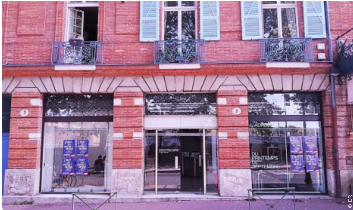
L'Adresse du Printemps de septembre sera le point d'information de la Nuit du patrimoine, de 16h à minuit.

BELLE ÉTOILE. Un parcours de propositions artistiques audacieuses dans des lieux emblématiques ou insolites de Toulouse. C'est le programme de la deuxième Nuit du patrimoine, imaginée cette année par le Printemps de septembre.