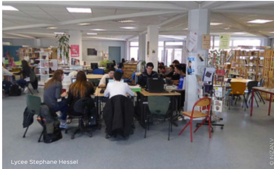
Lycée Stéphane Hessel

« Toutes les combinaisons ne sont pas possibles partout »